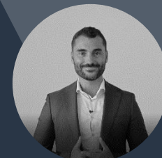
NICOLAS GONÇALVES CEO GROUPE EPSA

Il s'agit toujours d'un enjeu de conviction et d'engagement, et de réussir, d'ici 2026, à aligner les instruments et les leviers d'action de la RSE avec la performance économique de l'entreprise, pour une croissance durable.